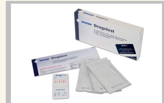
Enkele of Multi Drugstesten In speeksel of urine

Speekseltesten zijn wat nieuwer. Waar de eerdere speekseltesten moeite hadden om bepaalde drugs aan te kunnen tonen, zijn de ontwikkelingen de laatste jaren dusdanig dat ook speekseltesten op drugs betrouwbaar geworden zijn. Speekseltesten zijn over het algemeen genomen wat duurder om te produceren en kennen een wat hogere prijs. Daarnaast is drugs in urine vaak wat langer aan te tonen dan in speeksel. Er zijn echter ook duidelijke voordelen aan speekseltesten boven de urine testen. Speeksel is eenvoudig en discreet af te nemen en er is vrijwel geen mogelijkheid om te frauderen bij de afgifte van het speeksel. Ook de speekseltesten zijn verkrijgbaar in verschillende uitvoeringen.